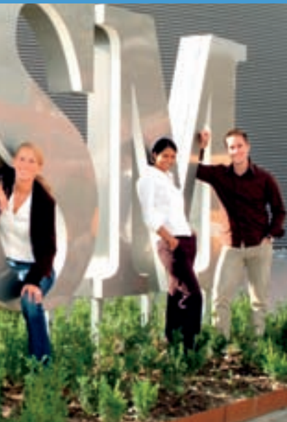
r ISM für internationales Flair.

Eine Delegation der Dortmunder Industrie- und Handelskammer, Handwerkskammer, Fachhochschule und Wirtschaftsförderung hat die englische Partnerstadt Leeds besucht. Für mögliche zukünftige Kooperationen wurden zahlreiche Kontakte in den Bereichen Wirtschaft und Wissenschaft geknüpft.