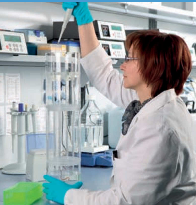
Auch in den USA steigt die Nachfrage nach den in Dortmund produzierten Protein-Biochips.